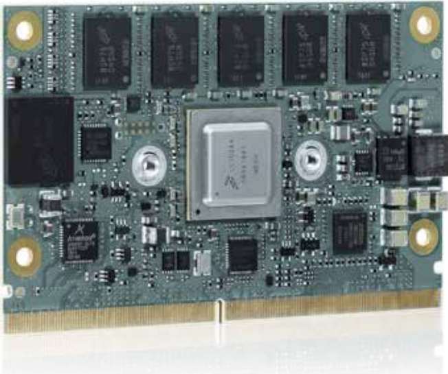
Das SMARC-sAL28-Modul im SMARC® Short-Size-Formfaktor bietet bis zu fünf integrierte TSN-fähige 1 GB Ethernet-Ports sowie einen Switch direkt aus dem Controller an. Damit eignet es sich ideal zum Einsatz in Industrial IoT bzw. Industrie 4.0-Systemen und für den Betrieb in erweiterten Temperaturbereichen zwischen -40° C und +85° C.

Damit eignet es sich besonders für Embedded-Anwendungen in der Medizintechnik, der Industrieautomatisierung sowie im Bereich Building Automation.