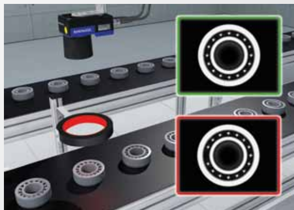
Inspektion von Kugellagern mittels Smart Kamera von Datalogic.